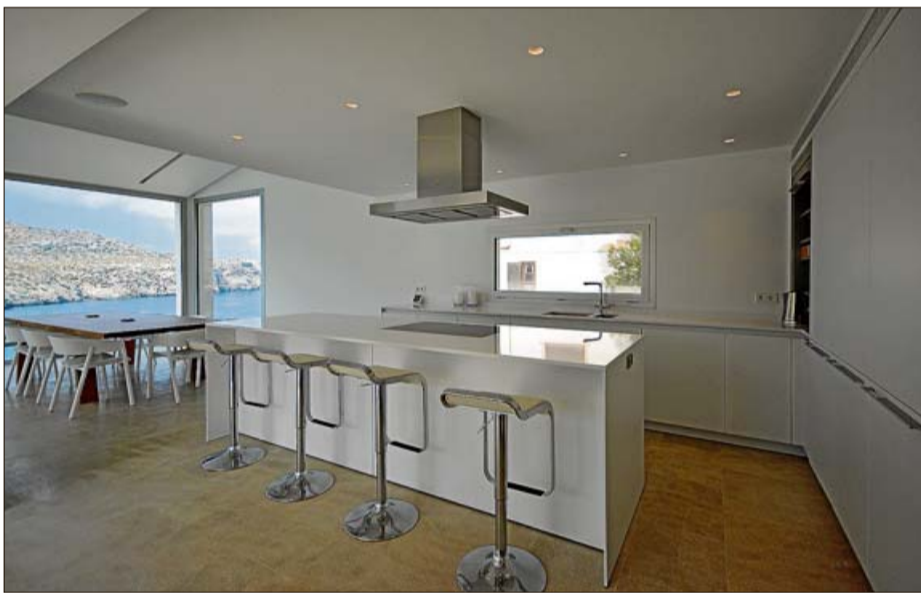
La cocina abierta dispone de una amplia barra para el tapeo o el desayuno.