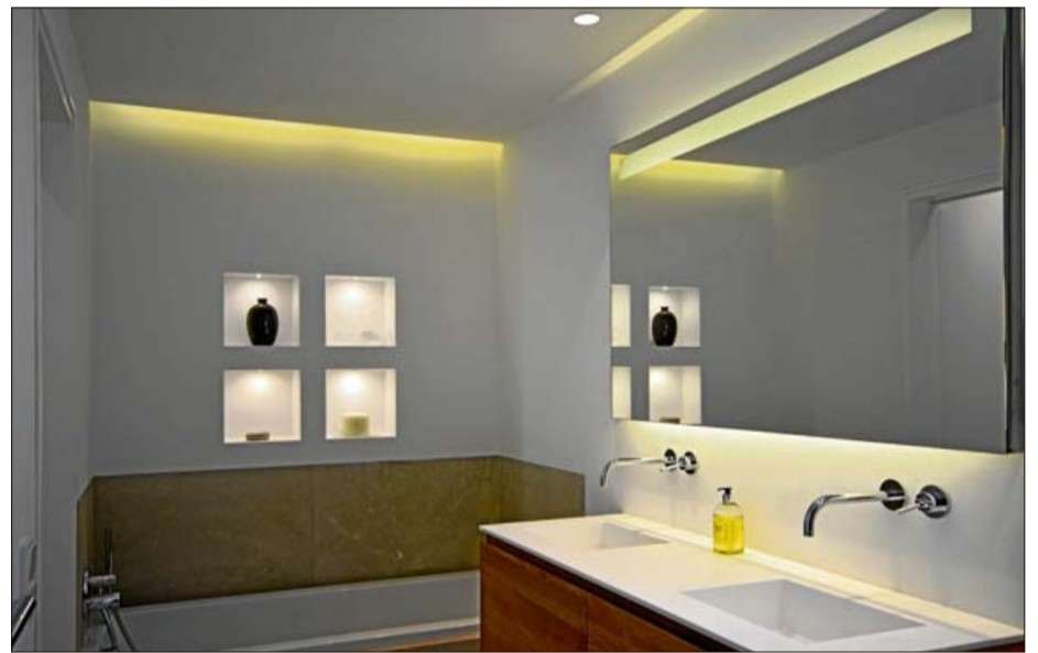
Los baños cuentan con una cálida luz indirecta.

que adaptarse a lo que había ya construido, un edificio típico de la época desarrollista sin un gran valor arquitectónico. Solamente se pudieron ordenar los huecos de las fachadas, limpiar las aristas y la piscina, esta intervención en lo que se refiere a la parte exterior de la casa, evidentemente en el interior todo es nuevo.