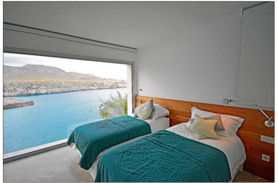
El gran salón comedor y los dormitorios disfrutan de grandes ventanales que convierten los paisajes de la cala en obras de arte creadas por la naturaleza.