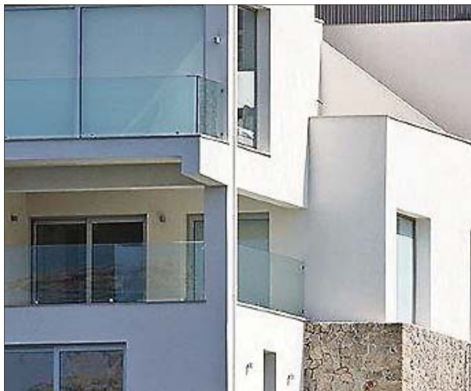
Los muros de piedra fusionan el blanco dominante de la vivienda con la montaña.

La obra que hoy les mostramos, una restauración obra del arquitecto Jaume March, tiene su porqué. El mar, cercano y bello, agresivo y vivo. Cala Carbó, situada a muy pocos kilómetros de Pollença es una de las zonas más bellas de la Serra de Tramuntana. Junto a Cala Molins, Cala Clara y Cala Barques forma el conjunto conocido como Cala Sant Vicenç y es la menos visitada de las cuatro por la inexistencia total de servicios turísticos, y podemos decir, que junto a la zona urbanizada se encuentra esta otra zona todavía protegida, o casi, de los estragos de la construcción que ha devorado otras zonas de la costa. La casa que hoy les mostramos es una de las construcciones más antiguas de esa roca montañosa que se acerca al Cavall Bernat y divide la zona de Sant Vicenç del famoso Moll de Pollença. De hecho este mordisco de mar paradisíaco se parapeta de los peligrosos vientos del norte mediante unos acantilados, sin vegetación y de mediana altu-