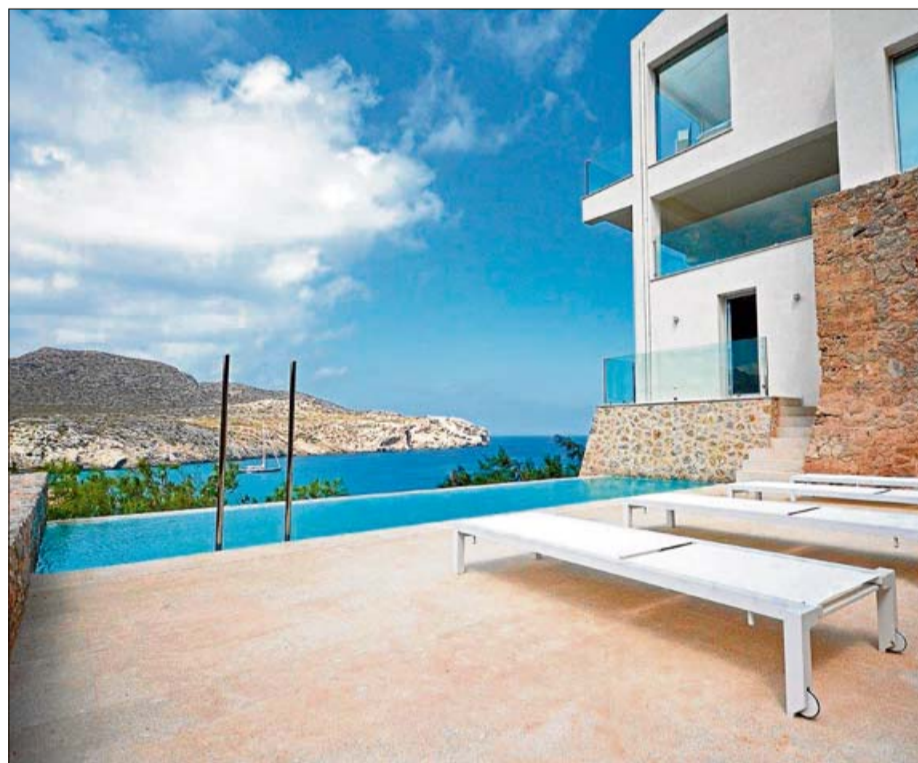
La piscina se funde con las aguas del mar.

La armadura de la estructura de la casa estaba totalmente afectada por la corrosión, habitual en casas tan expuestas a las inclemencias del tiempo y a la acción del mar cercano y barvío. Se tuvo por tanto que reforzar toda la estructura mediante lamas de fibra de carbono en vigas y pilares. Siguiendo el mismo plan las fachadas se aislaron por el exterior y se utilizaron productos ecológicos para que la casa transpire bien. Este es el producto, Kera-koll, que se ha utilizado ( http://www.kerakoll.com/es/productos/bio-filosofia ), muestra un trabajo en definitiva muy laborioso que merece ser tenido en cuenta. Y conocido. En los solados y alicatados se utilizó la piedra de Binissalem abujardada y cepillada. El cliente quería una casa sencilla y con poco mantenimiento, que no resultara complicada durante los me-