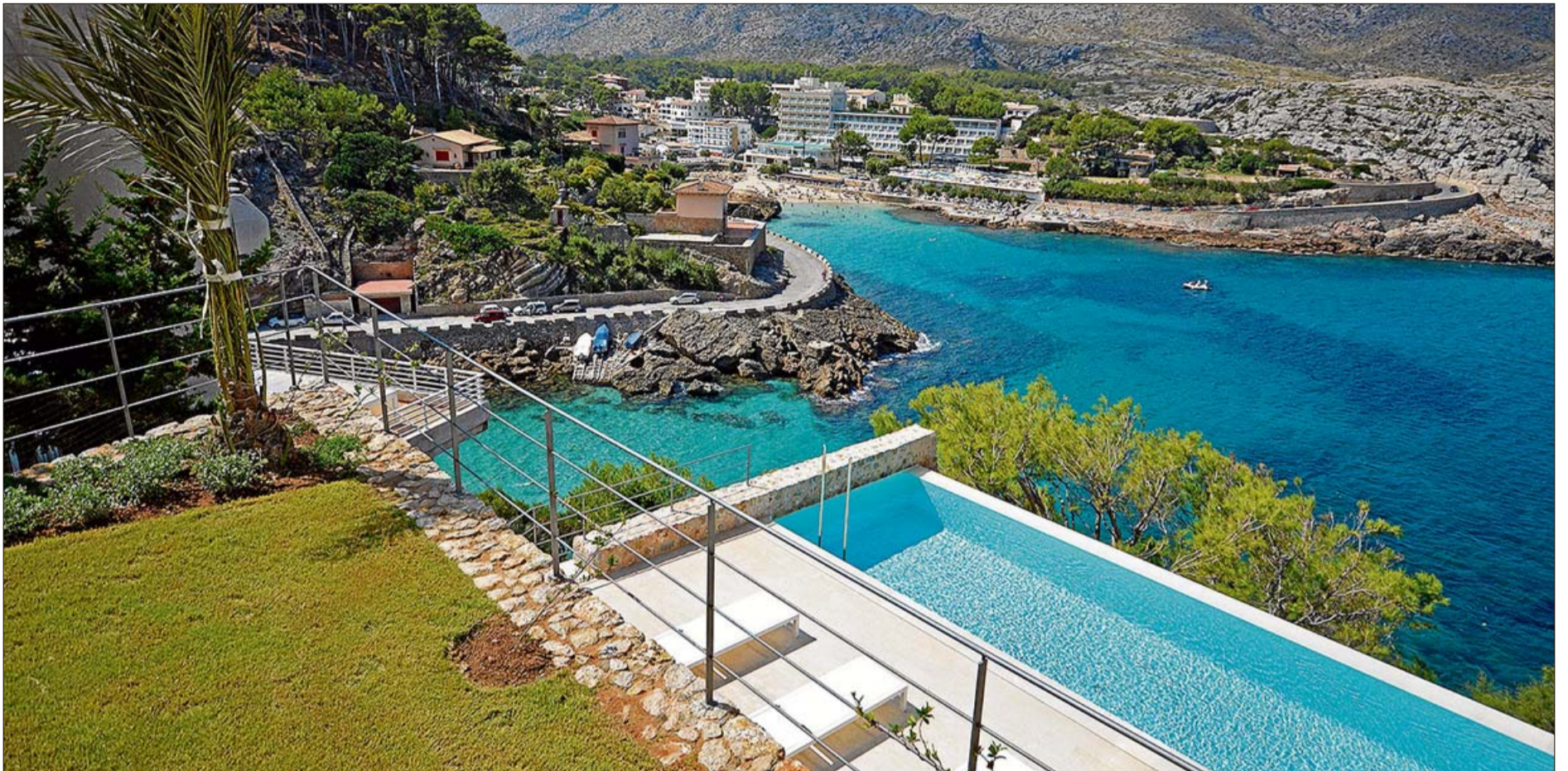
La casa es un mirador perfecto sobre Cala Carbó, en las inmediaciones del Port de Pollença, y todos los azules del Mediterráneo.