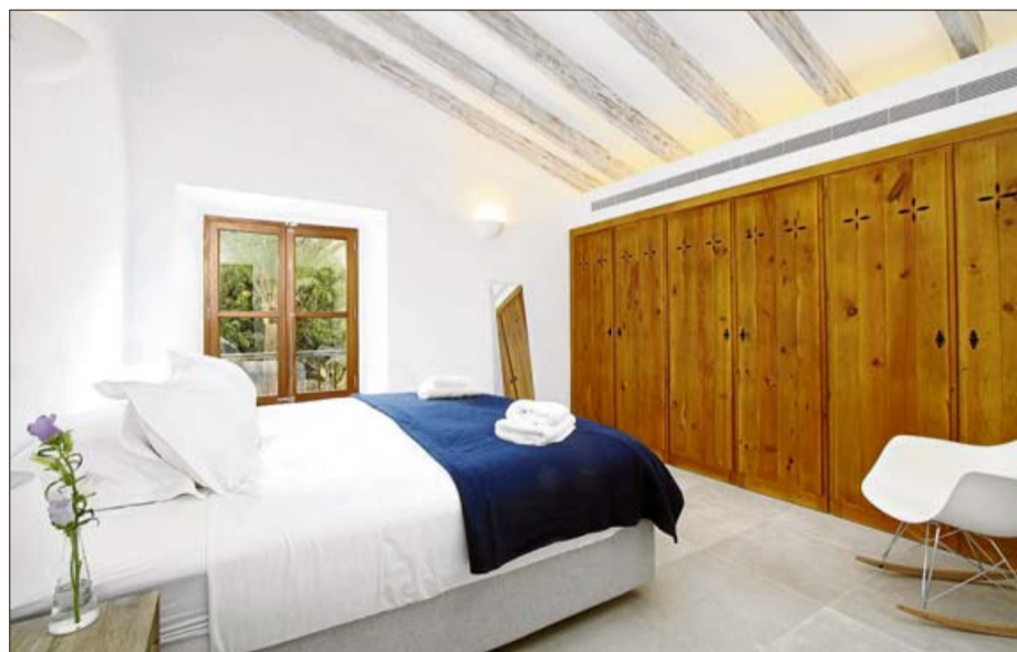
Una de las habitaciones con sus amplios armarios empotrados.