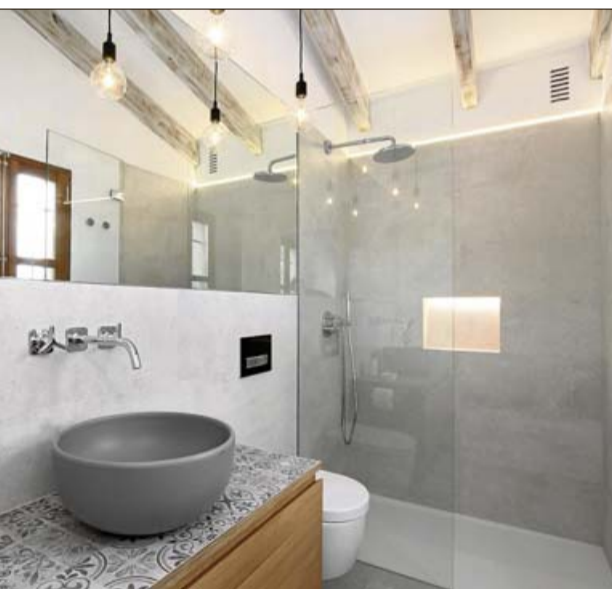
El baño con una ducha moderna y bien iluminada.