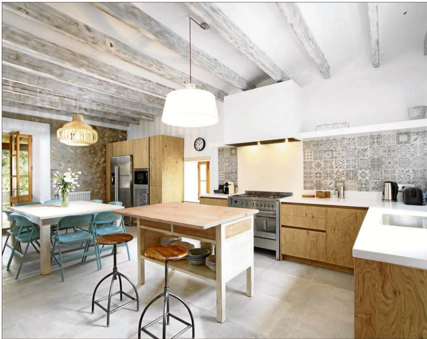
Se han recuperado las vigas mediante un decapé en blanco al igual que las puertas, originalmente de norte, se han pintado en blanco.

El término "casa rural", originalmente abarcaba una estructura de una pequeña vivienda, un granero y un patio cerrado, con el concepto de una casa de campo en una pequeña residencia. Las casas rurales o casas de campo, en sus inicios fueron probablemente pequeñas, oscuras y desagradables. En la época romántica, cuando la vida del campo comenzó a adquirir un valor intrínseco a los ojos de muchas personas, las casas de campo experimentaron un cambio de fortuna y la gente comenzó activamente a participar en la construcción y la búsqueda de casas de campo para uso como casas de vacaciones y residencias a veces como residencia permanente. Ocurrió con las más sencillas y también en las grandes propiedades que en Mallorca denominamos possessions . Es curioso pero hoy día la gente piensa en casas de campo como algo acogedor y las asocian con la comodidad y la vida minimalista, sin granja de trabajo y con un pequeño jardín en la mayoría de los casos diseñados para hacer que sea muy cómoda, o puede ser más simple y rústica. La que hoy les mostramos es una casa