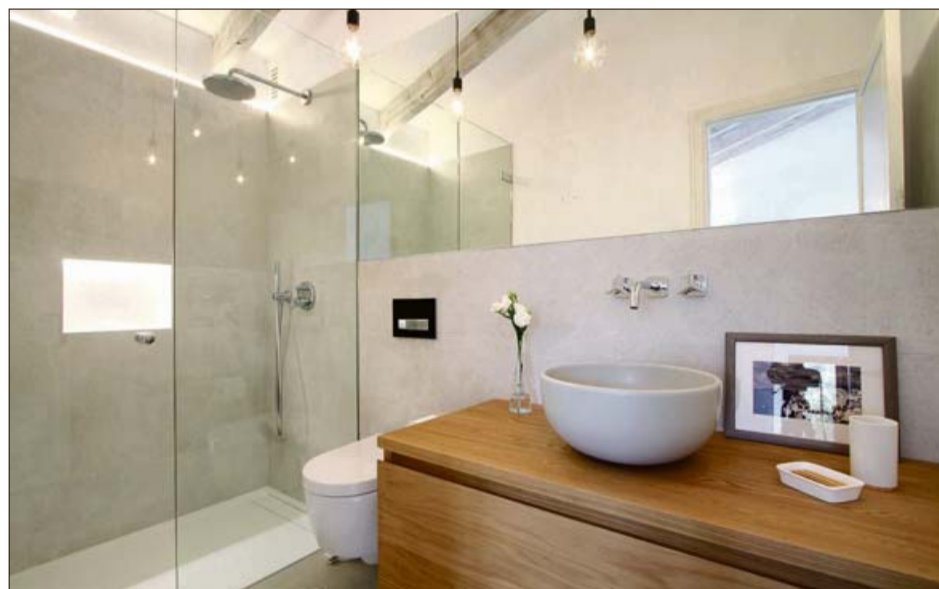
Especios en los baños y juego de iluminación tanto directa como indirecta.