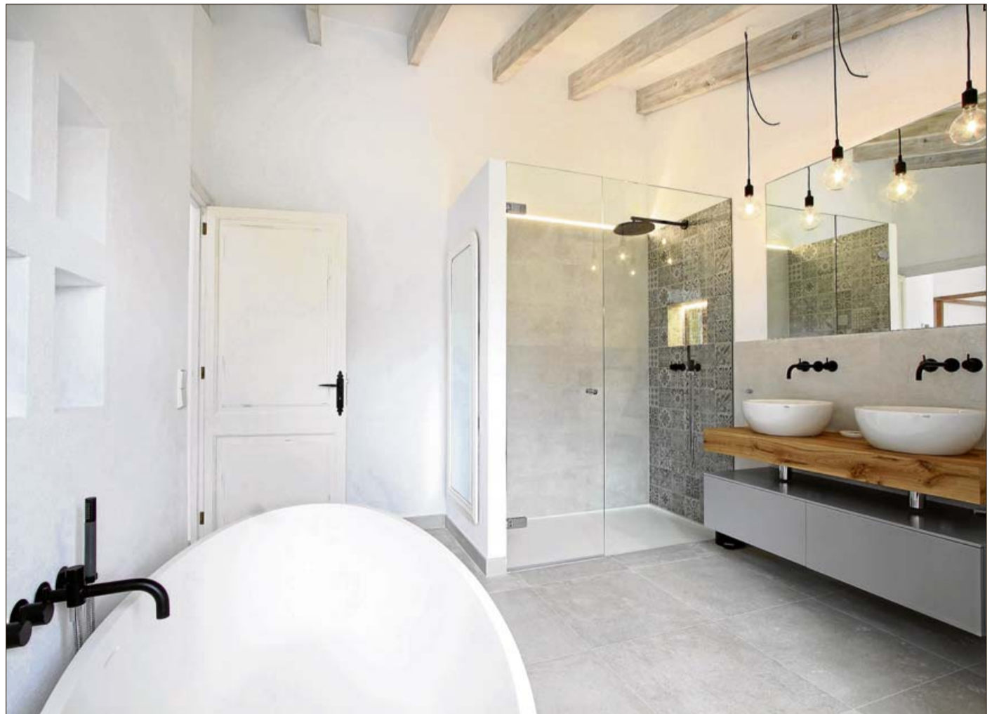
Las baldosas utilizadas son cerámicas en gris claro. Utilizadas en los solados de todas las estancias y alicatados de baños.