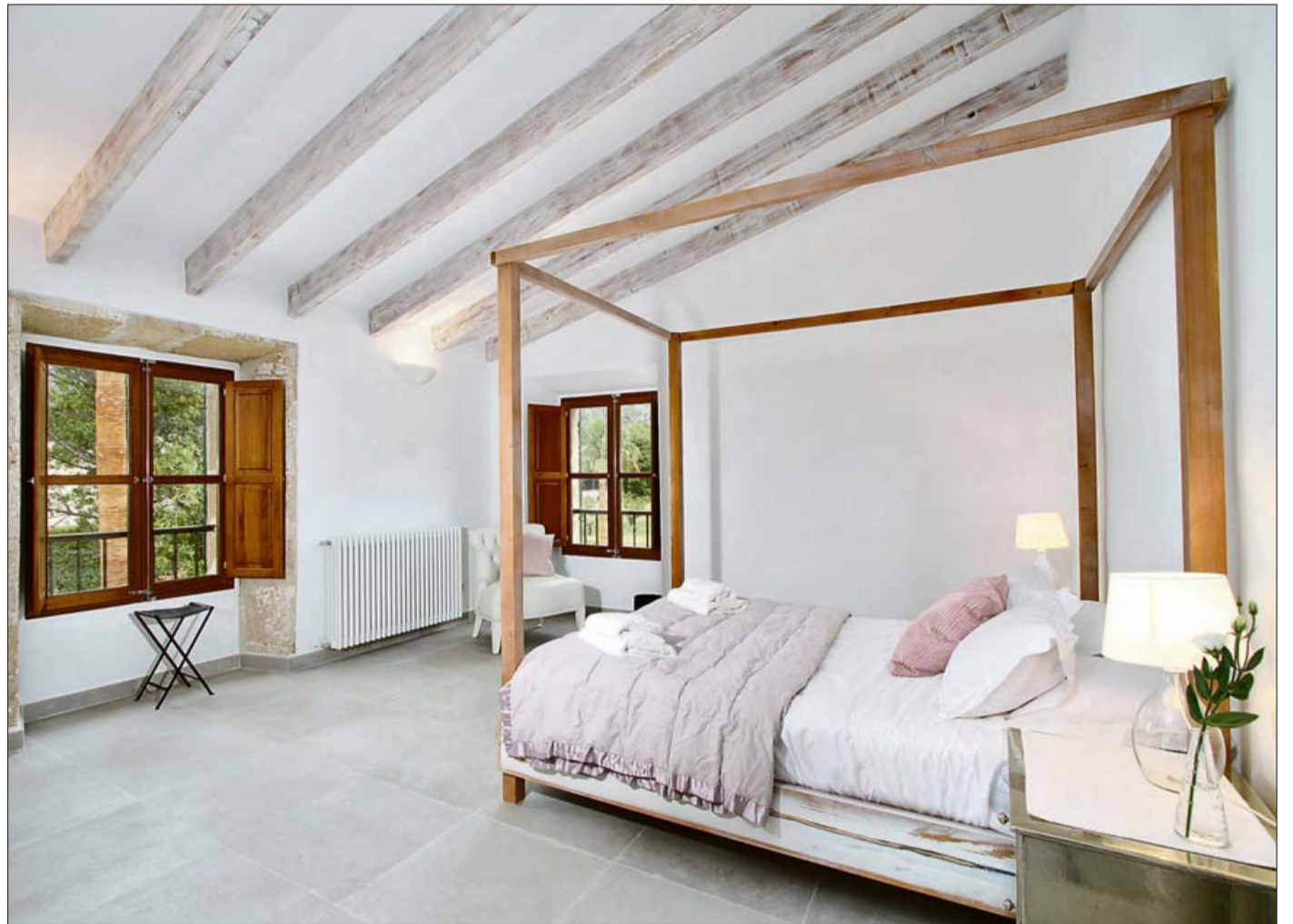
Una de las espaciosas habitaciones con ventanas que la dotan de una iluminación natural.