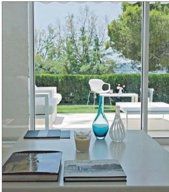
Vista del jardín desde el interior de la vivienda.