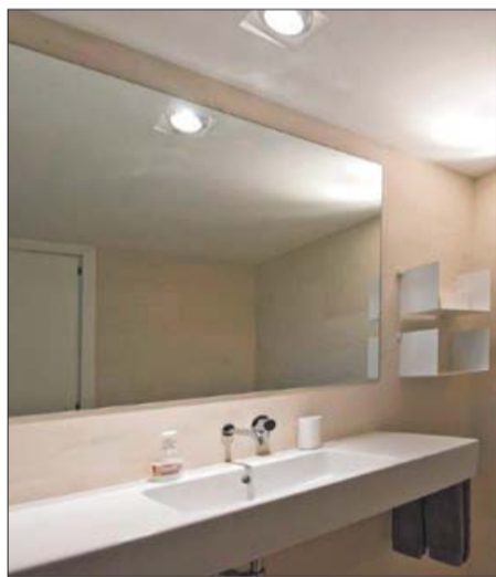
El baño de los dormitorios.