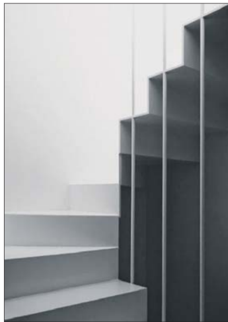
La escalera, sujeta por unos tensores.