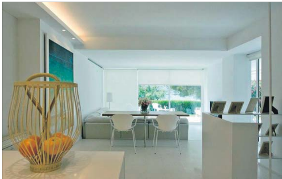
Otra perspectiva del salón de esta casa.