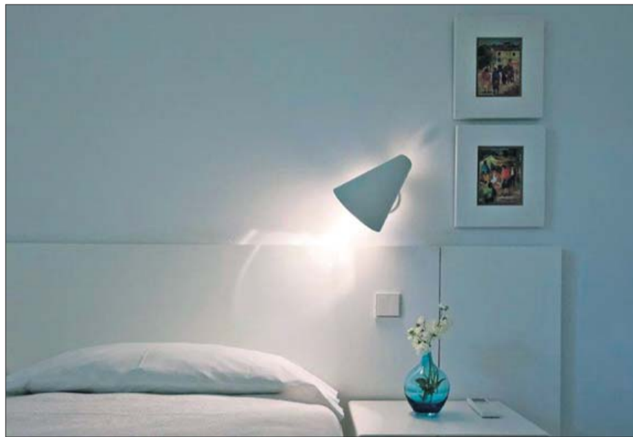
Los dormitorios, también de blanco y con una iluminación sutil.