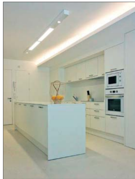
La cocina, también de blanco.