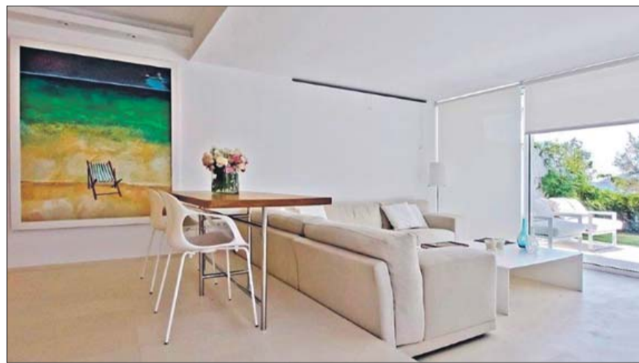
Espacios con decoración sencilla y amplitud de vistas.

chapa metálica macada, como la mesa de centro del salón o las mesitas de noche, incluso los estantes del baño, se unifican. Paz visual. La única pieza de otro color es la mesa comedor en madera de pino que sirve a su vez como extensión de la isla blanca de la cocina.