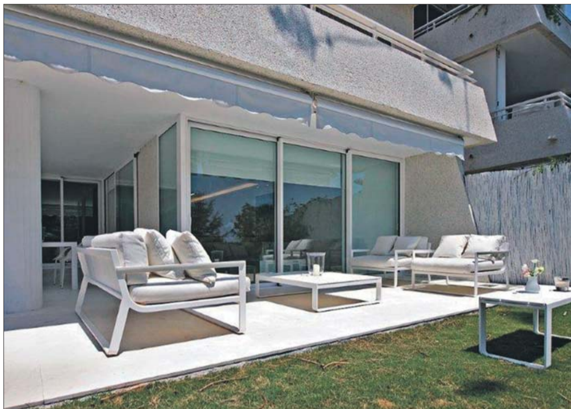
La terraza de la casa, que proporciona un agradable espacio para el descanso.