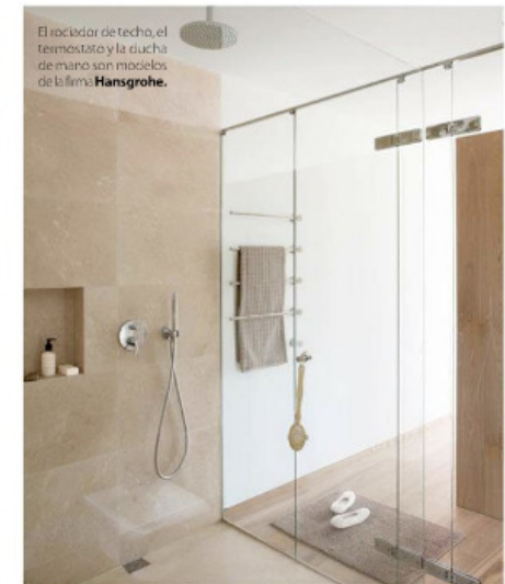
El rociador de techo, el termostato y la ducha de mano son modelos de la línea Hansgrohe .