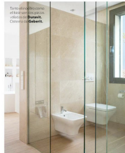
Tanto el inodoro como el bidé son las piezas voladas de Duravit . Cisterna de Geberit .